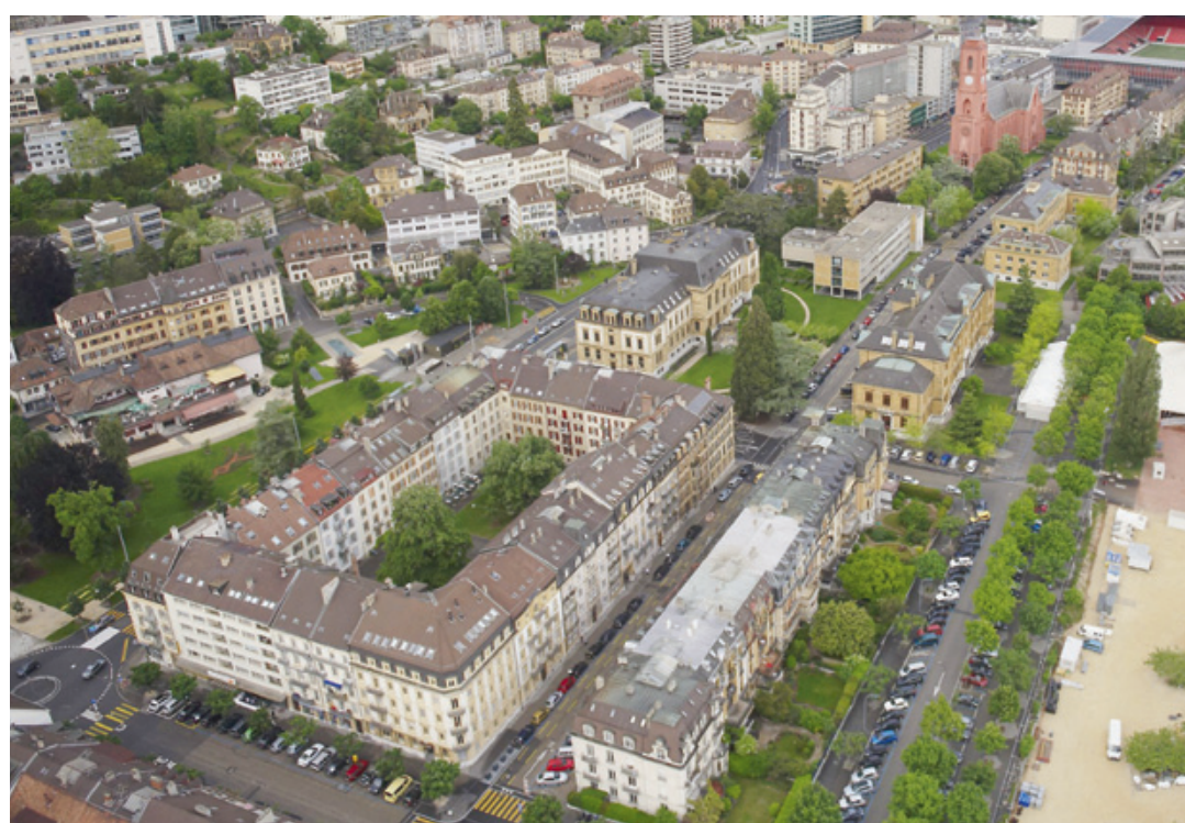
A Neuchâtel, un exemple d'habitat densifié à la fin du 19e siècle: des îlots d'habitations qui permettent d'offrir une grande surface de logement tout en conservant un espace de verdure.

L'initiative des Jeunes Verts vise aussi à «construire mieux et plus intelligemment en densifiant les espaces déjà urbanisés, par exemple les friches urbaines», explique Tristan Robert, coprésident des Jeunes socialistes neuchâtelois, membre du