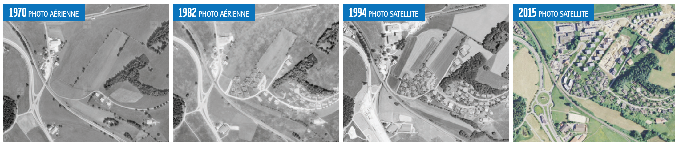
A l'entrée sud-est de La Chaux-de-Fonds, juste à côté du Bas-du-Reymond, le développement urbain des quartiers Cerisiers-Prés Verts entre 1970 et 2015.